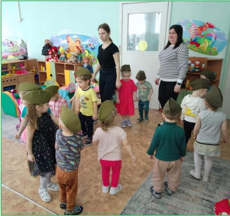
П/игра «Мы солдаты»