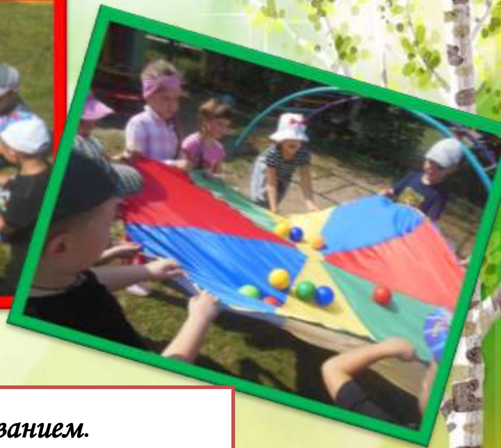
Игры с нестандартным оборудованием.