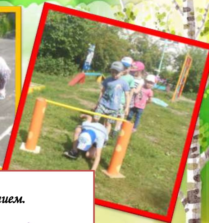
Игры с нестандартным оборудованием.