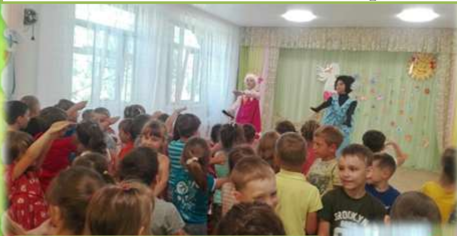
Выступление мурзичного театра