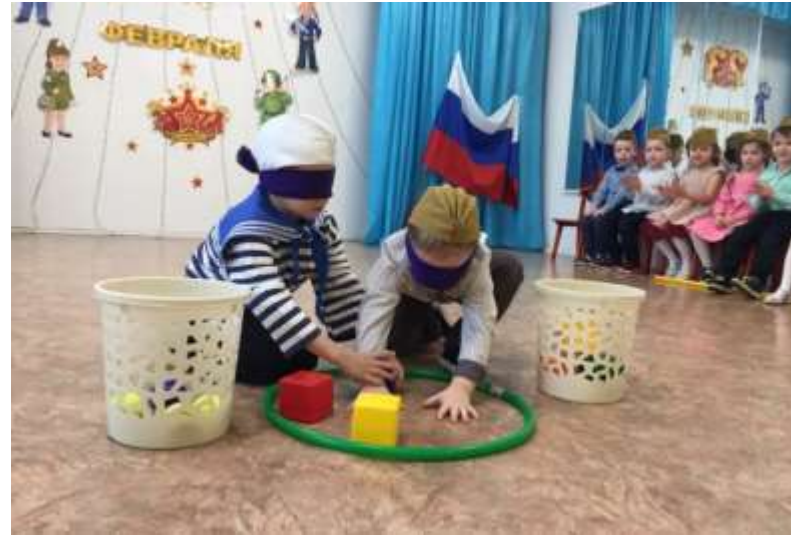
Конкурс капитанов «Сортировка снарядов»