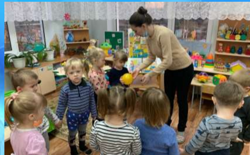
Игра «Добрые слова»