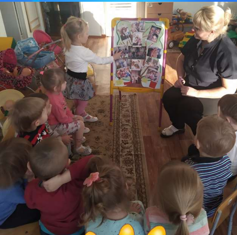
Рассматривание семейных фотографий