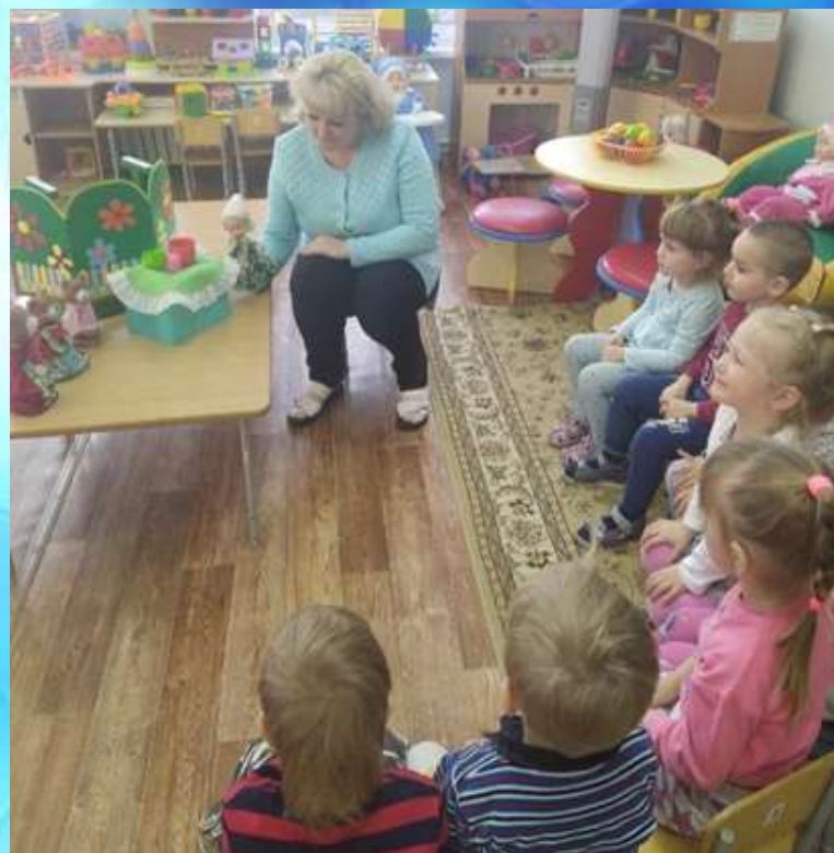
Театр бибабо « Три медведя»