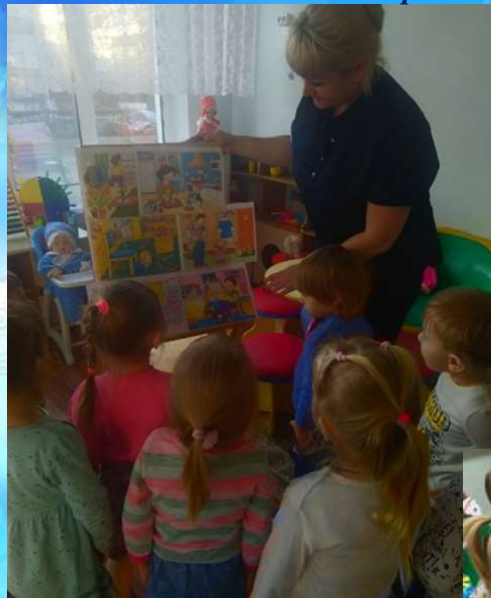
Рассматривание сюжетных картин «Дом. Семья»