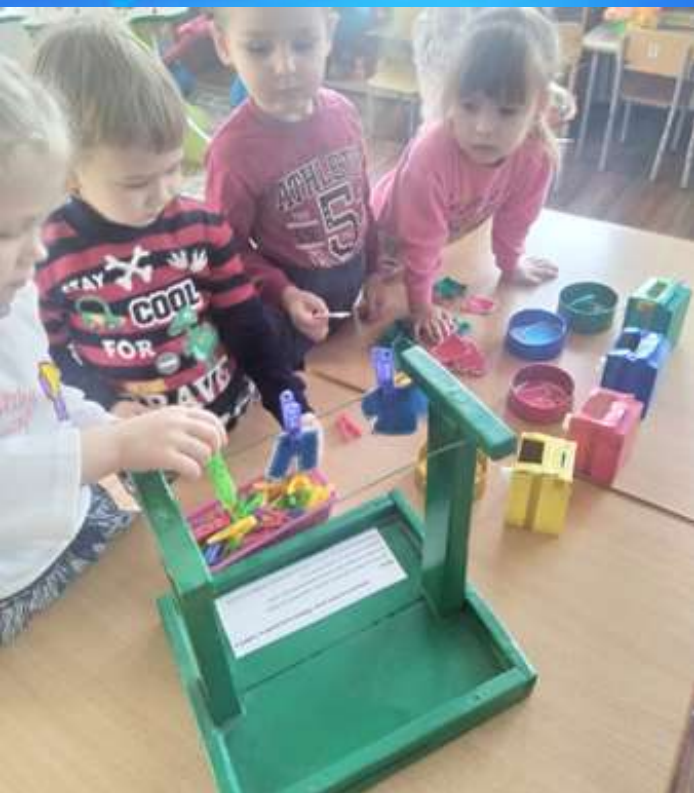
Игра «Мамины помощники»