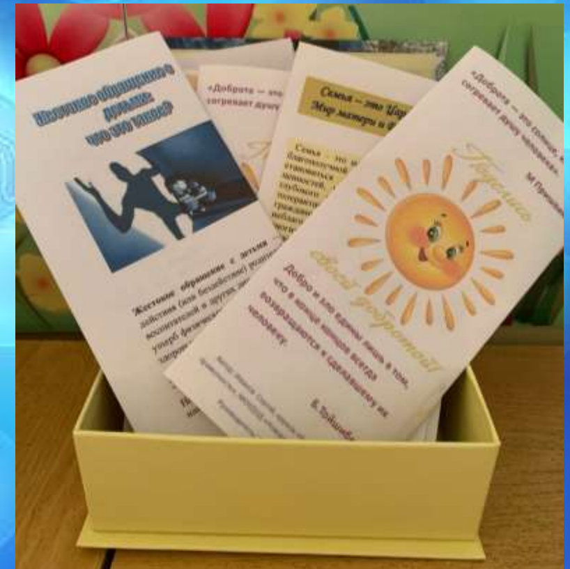
Буклеты для родителей