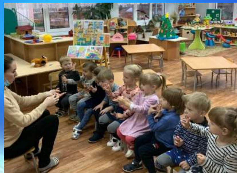
Пальчиковая гимнастика «Семья»