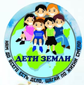
Команда «Дети Земли»