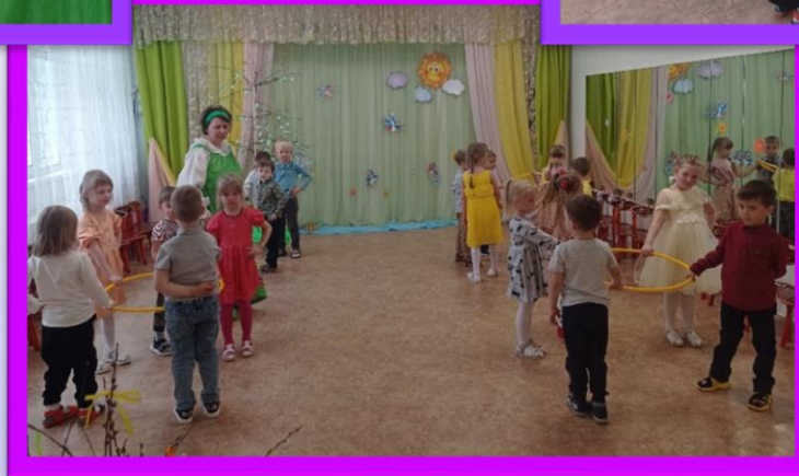
Русская народная игра «Солнышко — ведрышко»

Гори, солнце ярче – Лето будет жарче, А зима теплее, А весна милее! Солнышко с нами играет, Лучики в круг приглашает.