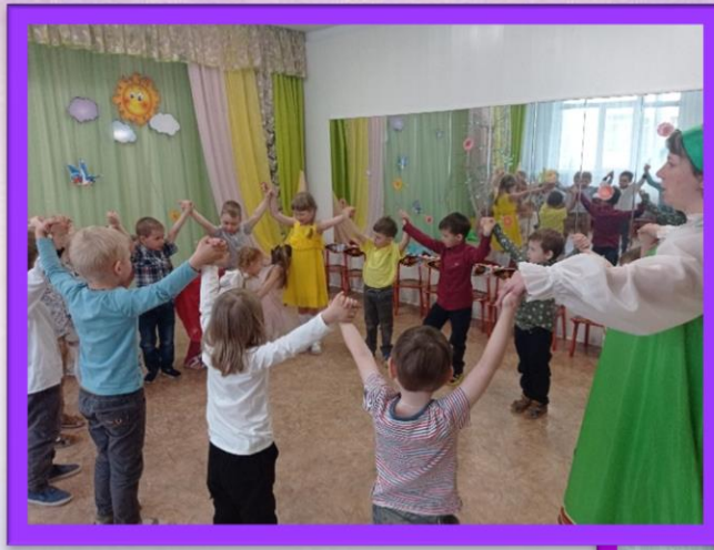
Подвижная игра «Бежит ручей»