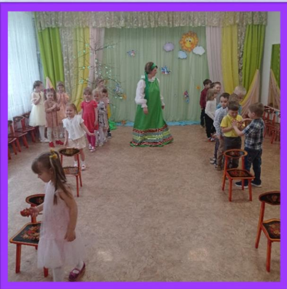
Игра «Бег с яйцом»