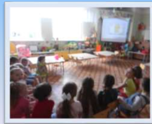
Игра «Детёныши и его мама»