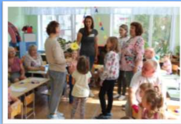
Игра «Музыкальная ромашка»

Если взять любовь и верность, К ним добавить чувство нежность, Все умножить на года, Что получится... Семья!