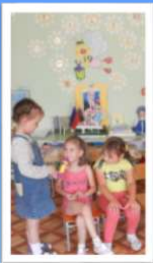
Игра «Я и моя семья»