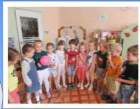
Игра «Ласковое слово»