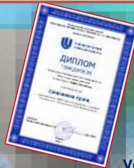
Участник: Швецова Варвара