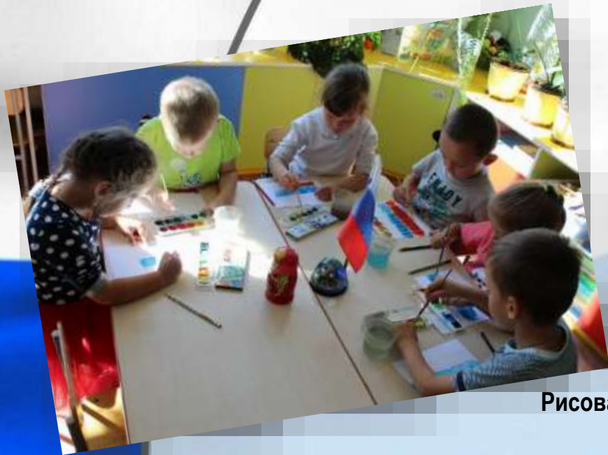
Рисование «Флаг России»