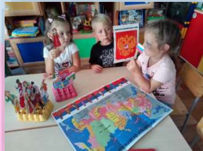
Дидактическая игра «Символика России»