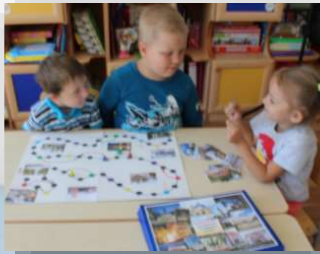
Дидактическая игра «Путешествие по родному городу»