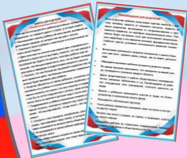
Памятка и рекомендации для родителей «Патриотическое воспитание в семье»