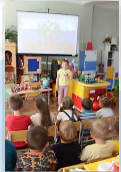
Рассказ детей из личного опыта «Что я знаю о России»