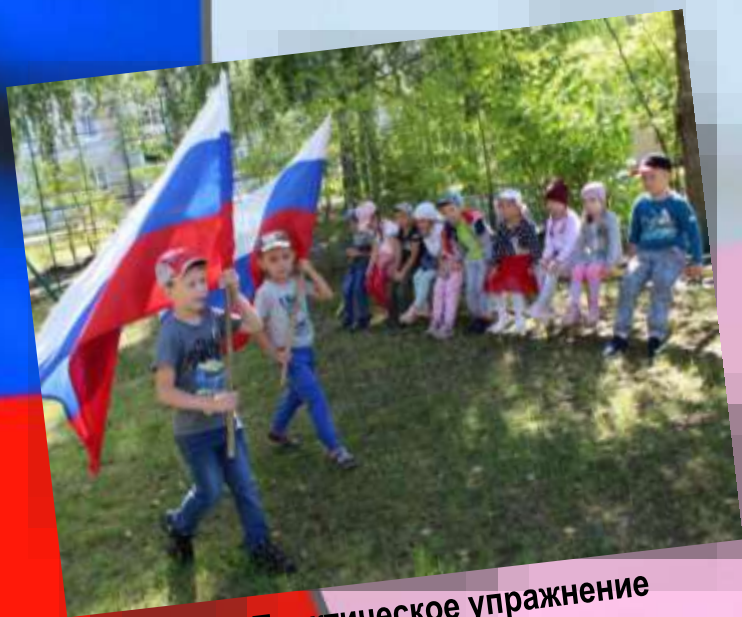
Практическое упражнение «Флагоносцы»