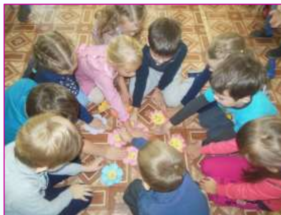
НОД «Что такое толерантность?»