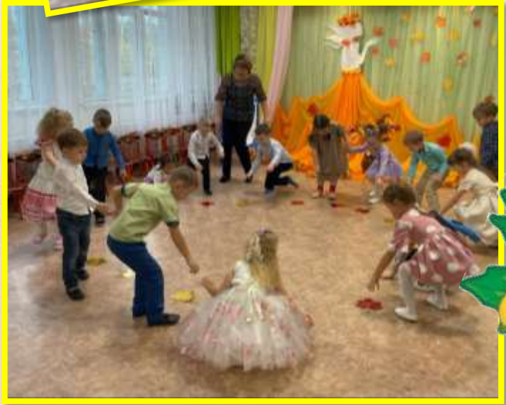
Подвижная игра «Осенние листочки».