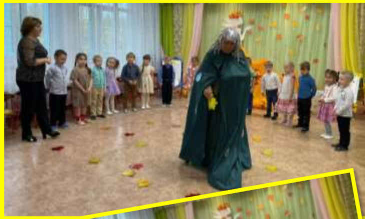
1 задание. Игра «Осенние приметы».