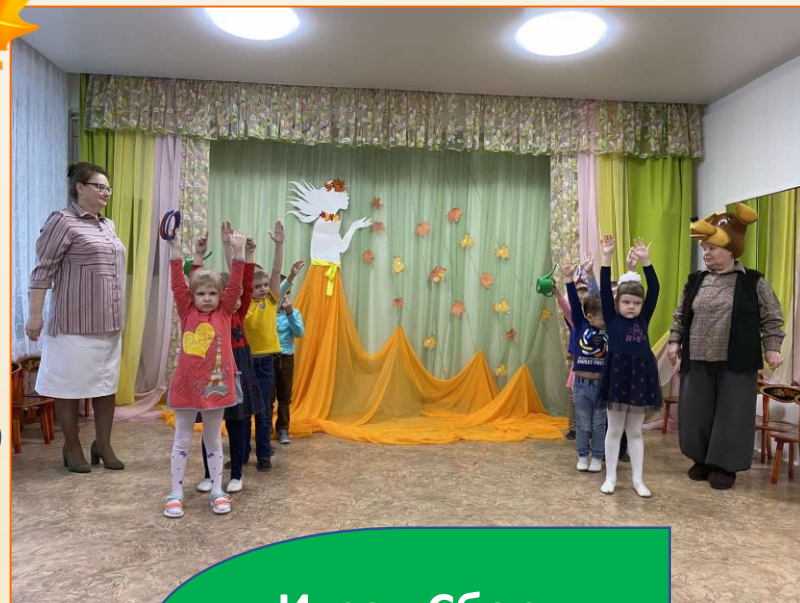
Игра «Сбор картофеля»