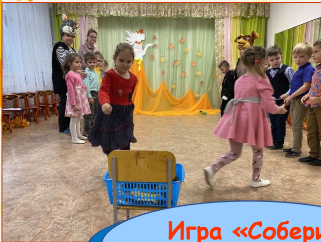
Игра «Собери шишки»