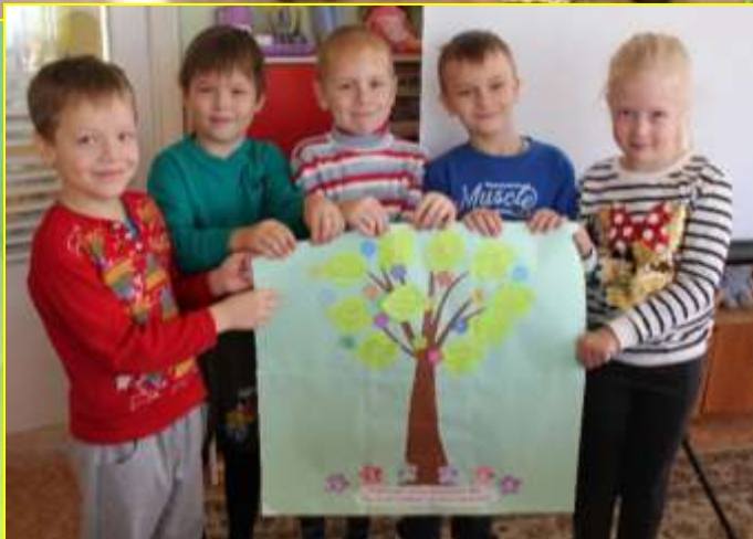
Коллаж «Дерево настроений»