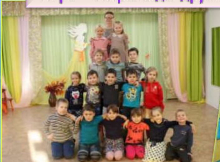
Игра «Пирамида дружбы»