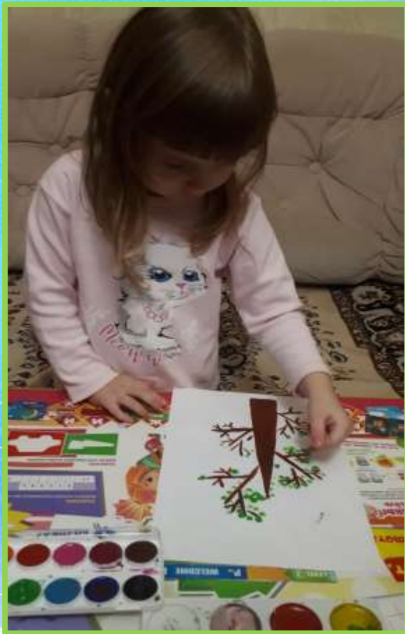
«Дерево мечты» рисование пальчиком