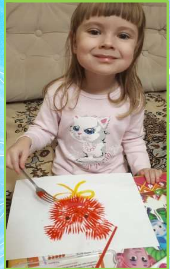
«Мишка» рисование вилкой