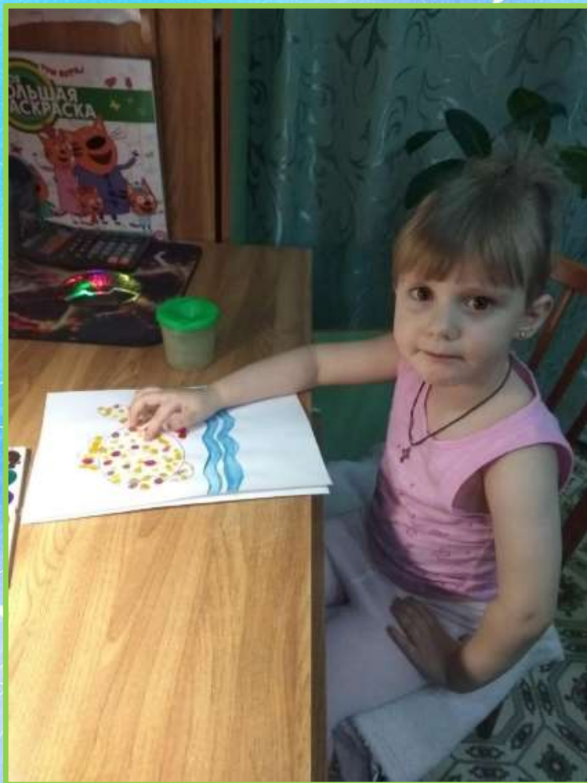
«Весёлая рыбка» рисование пальчиком