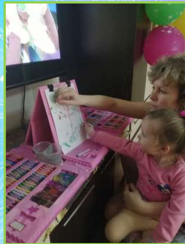
«Весенний лес» рисование ватной палочкой