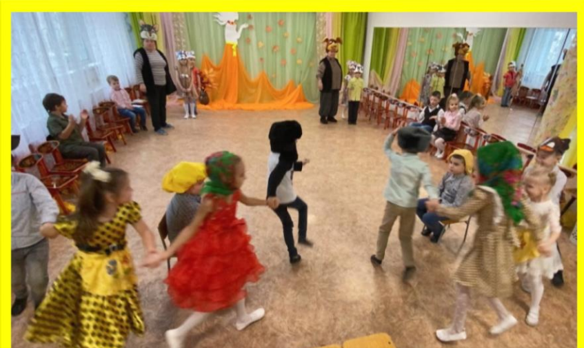
Сбор урожая для Шарика и Матрскина