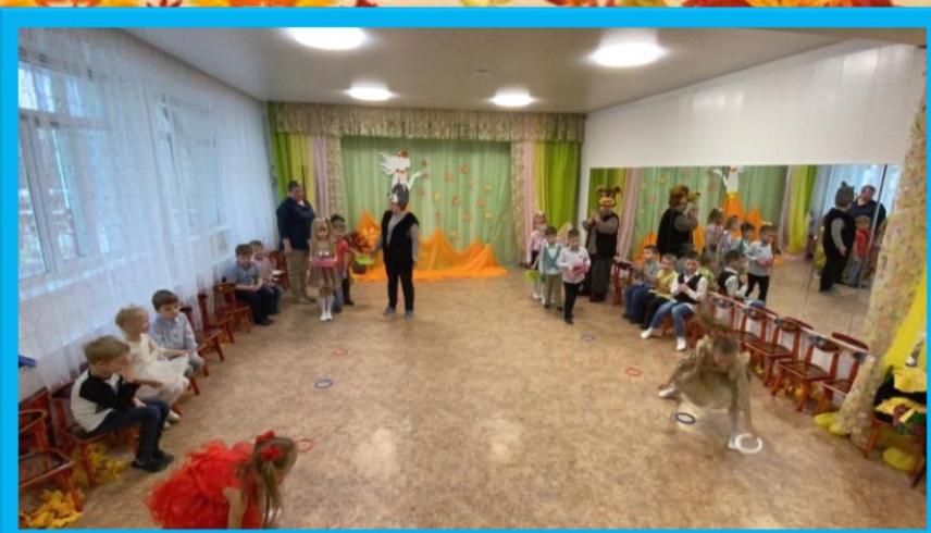
Веселые игры в Простоквашино