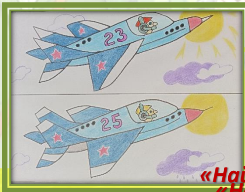
«Найди отличия» «Найди отличия»