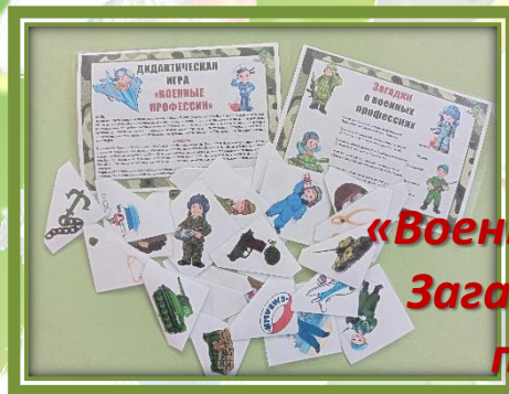
Дид. игра «Военные профессии» Загадки о военных профессиях