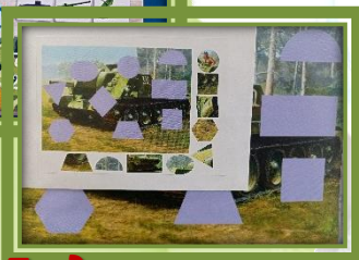
Дид. игра «Заплатки»