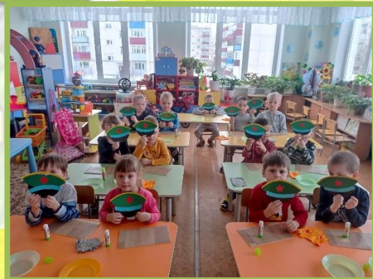
Аппликация «Подарок папе»

Папу очень я люблю Ему подарок подарю. Поцелую и обниму. Вот как я его люблю!