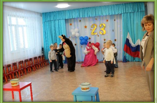
Эстафета «Варим уху»