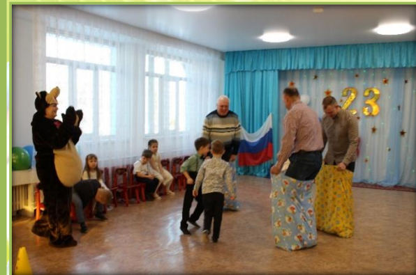
Конкурс «Разминируй поле».