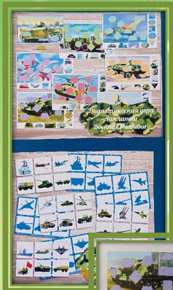
Дидактическая игра «Защитный десятизначник»

Дидактические игры по патриотическому воспитанию своими руками.