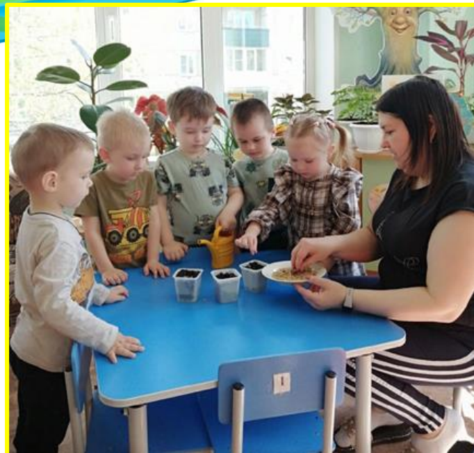
Сажает горох и пшеницу, Есть ребятам, чем гордиться!