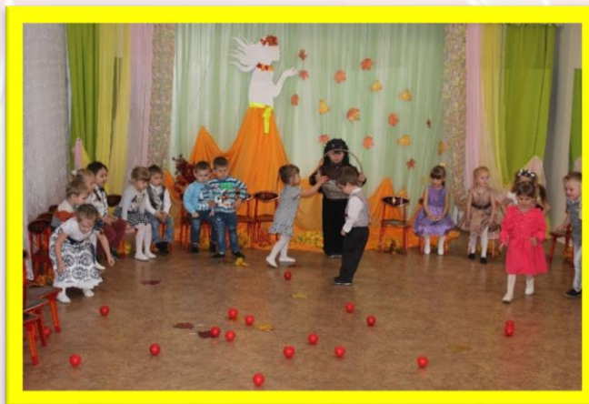
П.игра «Помоги ежику собрать яблочки в корзину»