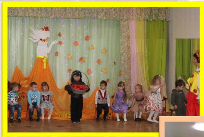
Веселый танец «Грибочки»