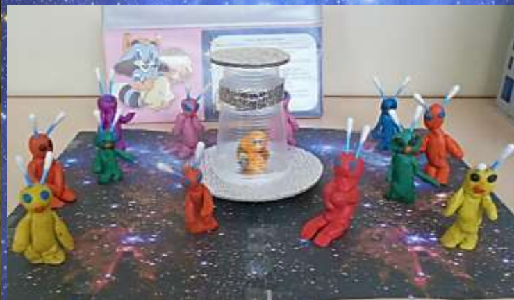
Творческие работы детей по лепке «Гости из космоса»