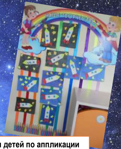
Творческие работы детей по аппликации «Полёт на ракете в космос»