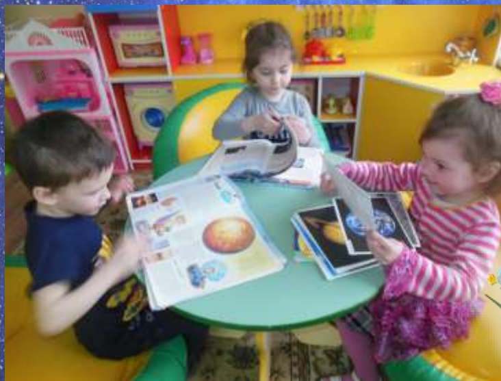
Рассматривание иллюстраций о космосе