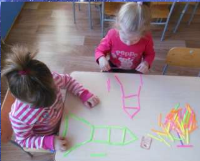
Выкладывание из счетных палочек солнышко, ракеты,