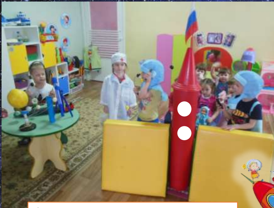
Сюжетно-ролевая игра «Полёт в космос»