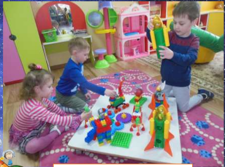
Творческая игра «Космодром»