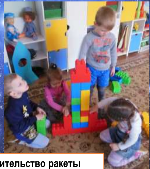
Строительство ракеты из конструктора