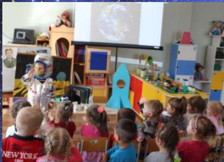
НОД «Что такое космос?»

Проект был построен в соответствии с задачами ФГОС ДОУ и интеграции всех образовательных областей: «Социально-коммуникативное развитие», «Познавательное развитие», «Физическое развитие», «Художественно-эстетическое развитие», «Речевое развитие» и включал в себя следующие виды деятельности: НОД по окружающему миру «Что такое космос?»; рассматривание материала по теме «Космос»; беседы «Какое бывает небо?»; «Что живёт в небе?»; чтение стихотворений, загадывание загадок на тему «Космос»; выкладывание из счетных палочек (путем наложения) ракеты, звездочки, самолета, солнышко; подвижные игры: «Солнышко и дождик», «Солнечные зайчики»; «Лётчики на аэродром», пальчиковая гимнастика «Тучки», «Солнышко светит»; сюжетно-ролевая игра «Полёт в космос»; дыхательная гимнастика «Ветерок»; физкультминутка «Ракета»; просмотр мультфильмов «Белка и Стрелка», «Лунтик», «Незнайка на луне»; слушание песен «Разукрасим все планеты» (Барбарики), «Облака белокрылые лошадки»; лепка «Гости из космоса»; аппликация «Полёт на ракете в космос».