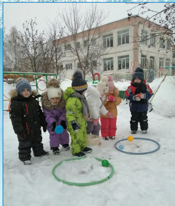
Танец игра «Весёлые снежинки»