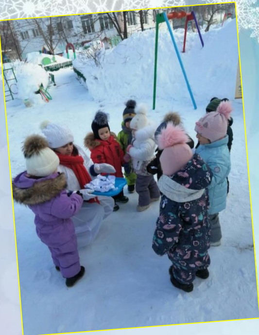
Спортивная игра «Попади в цель»