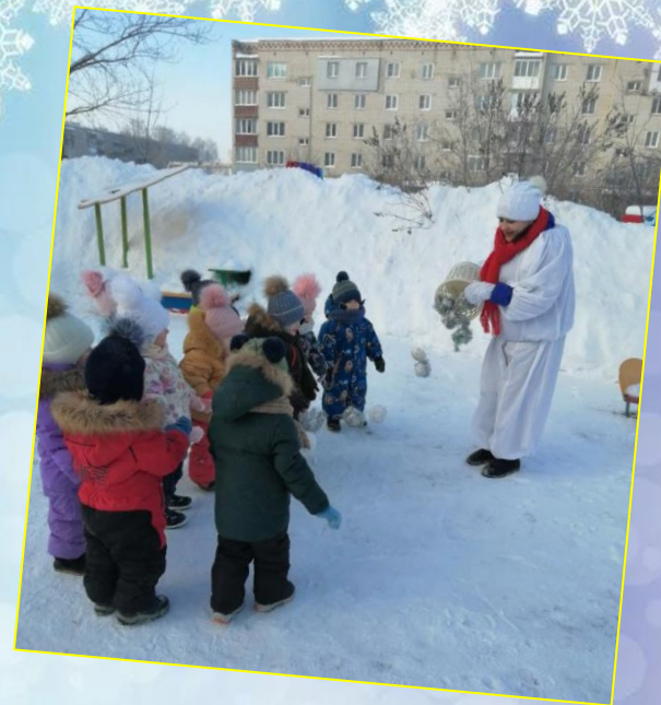
Дыхательное упражнение «Сдуваем снежинки»