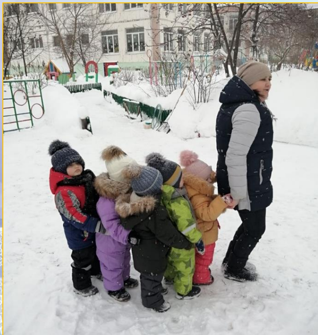
П/ игра «Поезд»